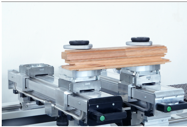
Fijación mecánica VCMC-B-QUICK fijando marcos