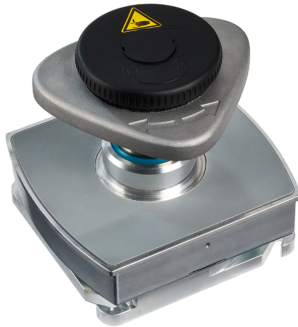
Fijaciones mecánicas VCMC-B-QUICK